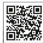
A 大島青松園コース